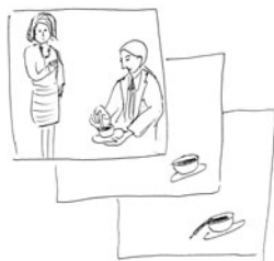
「その時の何かを思い出すときに出来ること」