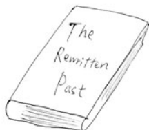
「塗り替えられた過去についての本」